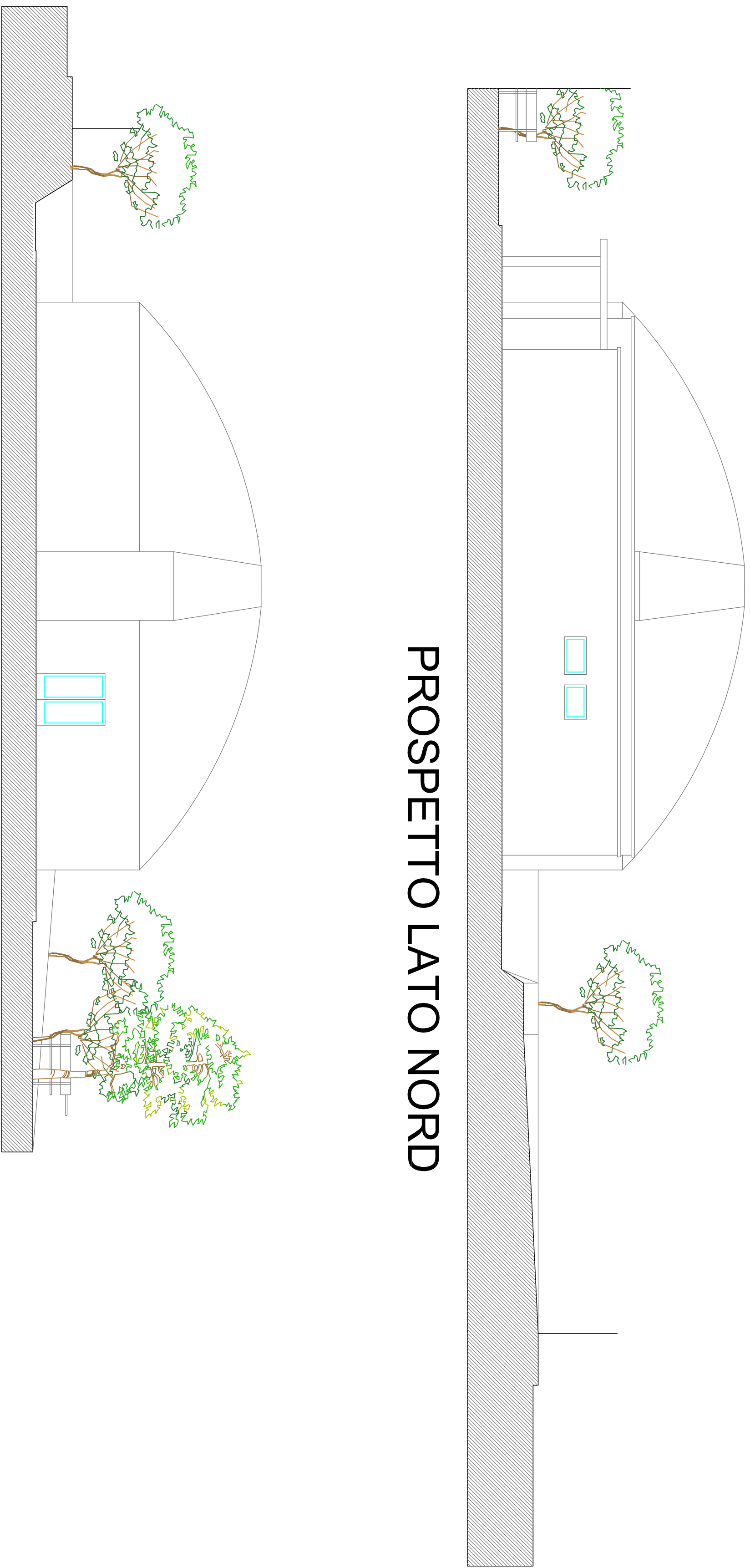
PROSPETTO LATO NORD