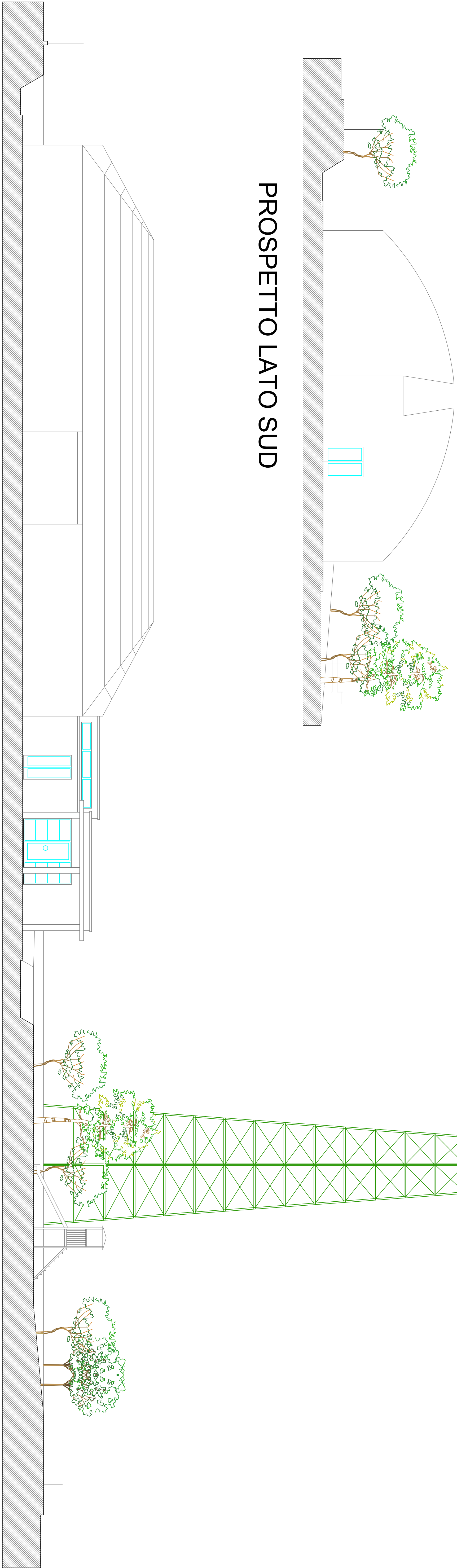
PROSPETTO LATO SUD